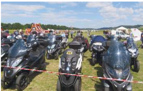
Letalski dan je obiskala tudi velika skupina motoristov iz vse Slovenije.

Zares si je bilo na območju osrednjih Slovenskih goric, ki je še ne tako dolgo nazaj veljalo za manj razvito, zanimivo ogledati številna letala, motorje, letalske modele, motorne zmaje in druge proizvode najsodobnejše tehnologije. Očitno se Cerkevjenjak z Aeroklubom Sršen, ki ima več kot 22-letno tradicijo in več kot 60 članov, od tega