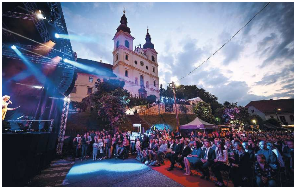
Trojiški trg je bil vsak večer pretesen za obiskovalce.

Poleg nastopov glasbenih skupin je letošnja Trojicafest postregel z Ulico okusov, ki je poskrbela za bogato ponudbo hrane, pijače in drugih izdelkov ter navdušila velikansko množico obiskovalcev iz vseh koncev Slovenije. Zelo zanimiva dogodka sta bila tudi letos Vinska galerija in Kibflajšfest , ki sta v mogočni Martinovi protokolarni kleti dobesedno navduševala obiskovalce s pokušino vrhunskih vin iz štajerskega vinorodnega okoliša in z domačim kibflajšom. Posebna strokovna komisija je celo ocenila nekaj vzorcev te priljubljene in zelo cenjene mesne jedi. V štirih festivalskih večerih je bil posebno doživetje Secret garden , na katerem so znani DJ-ji poskrbeli za vrhunsko nočno zabavo, Pomlad na jasi pa je otroke popeljala v čaroben svet iger in zabave. Osrednje festivalsko dogajanje se je odvijalo na velikem odru v občinskem središču pred zgradbo Občine Sveta Trojica. Tam so množico navdušenih obiskovalcev zabavali Nina Pušlar , Žan Serčič , MI2 in Kvatropirci . Trojiški trg je bil vse štiri večere prenapolnjen in