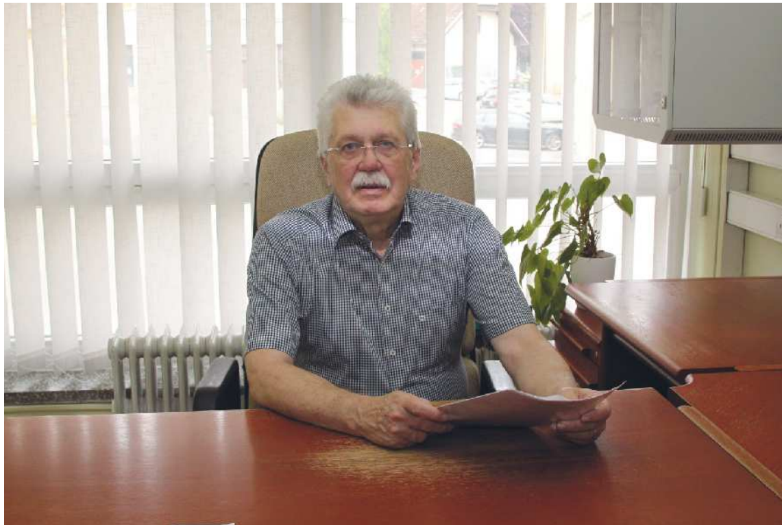
28 let notarske službe v Lenartu je hitro minilo.

Marjan Toš, besedilo Maksimiljan Potočnik, fotografija