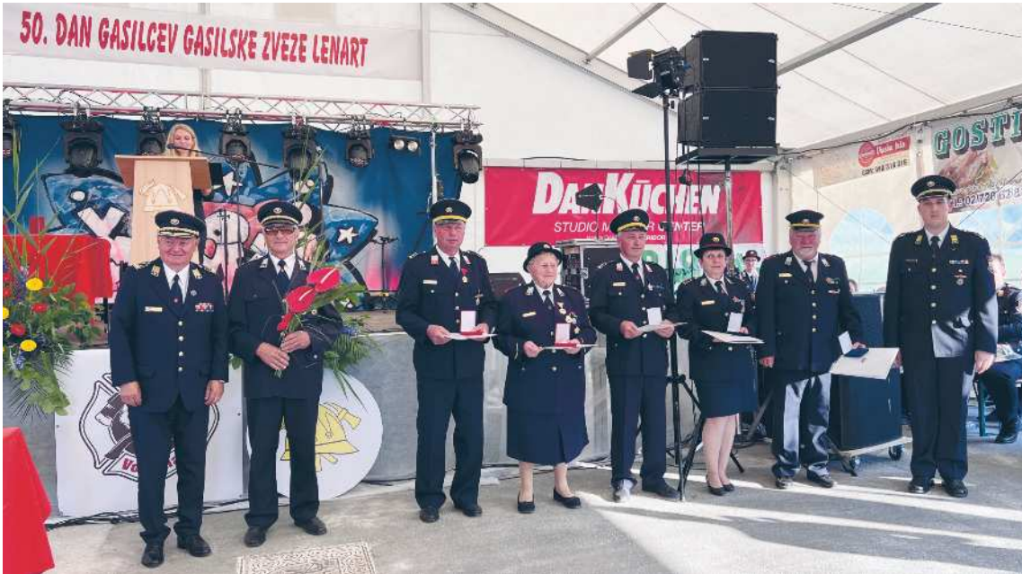
Prejemniki državnih priznanj in odlikovanj za njihove dosežke za izjemen doprinos na področju gasilstva.