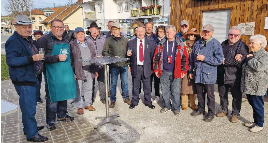
Turistično-vinogradniško društvo Benedikt ob dvajseti obletnico šteje 57 članov.

Barbara Ribič, besedilo