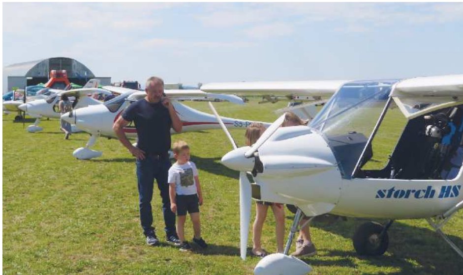
Na letalskem dnevu v Cerkevjenjaku je bilo kot v čebelnjaku – ultralahka letala so kar naprej pristajala in vzletala, da o vragolijah letalskih modelov v zraku niti ne govorimo.