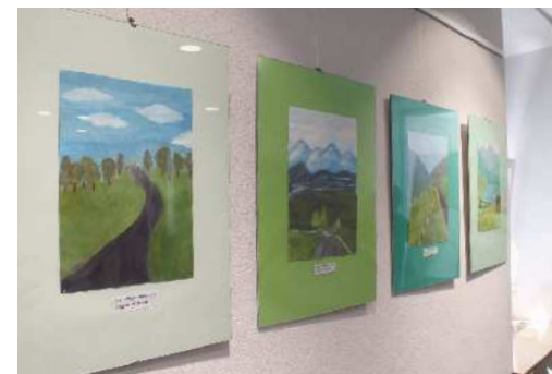
Razstava v avli Antona Fašinga vabi na ogled.

Obe razstavi bosta na ogled še nekaj časa. Vljudno vabljeni, da si ju ogledate.