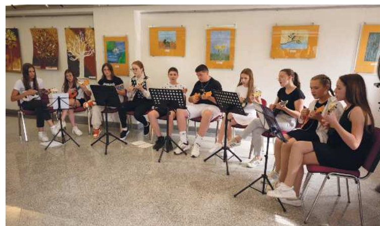
Utrinek iz dogodka v avli Jožeta Hudalesa v Lenartu.

predstavitvi vseh področij umetnosti. Zato sta obe otvoritvi vključevali čudovite glasbene, plesne in literarne točke.