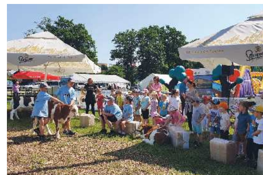
Vodenje teličkov za pokal Liska - Govedorejsko društvo Slovenske gorice

Na prvi dan sejmskega dogajanja so pripravili posvet z naslovom Pomen humusa in organske snovi v tleh za kmetijsko pridelavo . Govedorejsko društvo SG Lenart je ponovno pripravilo Vodenje teličkov za pokal LISKA. Izbrali pa so tudi sejmsko vino, ki so ga izbrali iz vseh sejmskih vin; to je postalo vino rumeni muškata Vina Kramberger. Vznemirljivo tekmovanje v kuhanju štajerske kisle župe za nagrado Kos Zlata žlica 2023 je v soboto pritegnilo sedem ekip. Strokovna komisija je odločila, da je zmagovalno mesto zasedla ekipa »Občinske kuhne,« ki je prejela prestižno Zlato žlico. Srebrno žlico je osvojila ekipa Radia Slovenske gorice, medtem ko je bronasto žlico prejelo Konjeniško