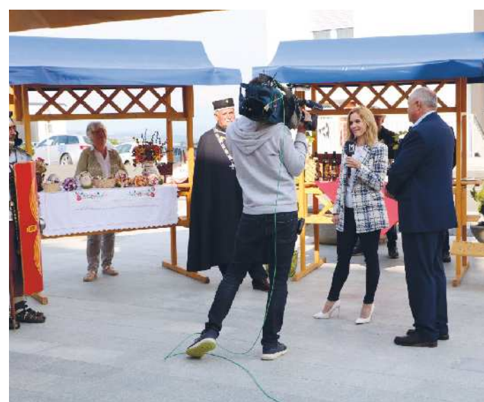
Vklp v oddajo Dobro jutro na RTV Slovenija je potekal v živo izpred trga v Cerkvenjaku in vzletišča v Čagoni.

Kot smo izvedeli, so na Občini Cerkvenjak po oddaji zvonili telefoni. Ljudje iz vseh koncev Slovenije so se zanimali, kaj vse pripravljajo za obiskovalce. Verjetno je bil tudi zaradi tega letos obisk ljudi iz drugih krajev Slovenije na prireditvah v okviru cerkvenjaškega občinskega praznika večji. V resnici bi lahko prireditve v okviru občinskih praznikov z manjšimi dopolnitvami pripravili in promovirali tako, da bi se uveljavile kot zanimive turistične prireditve za obiskovalce od drugod, tudi iz tujine.