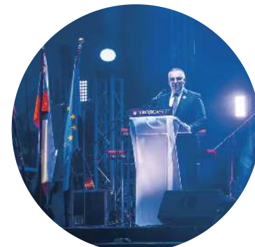
Slavnostni govornik je bil predsednik državnega sveta RS Marko Lotrič.